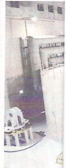
中部電力の徳山水力発電所の建屋地下70メートルにある1号機の発電機。徳山ダムのふもとにたつ建屋。いずれも岐阜県揖斐川町で

鞘に日本刀を収めた格好のデザインで、はさみを開くと刀を合わせたように見える。店頭想定価格は1500円。大きさは10.5センチでペンケースや化粧ポーチに入れて携帯できる大きさにした。職人が刃付けをする手作り品で切れ味が抜群。刀の反りや刃紋、柄の形状にまでこだわったという。同社は戦国武将真田幸村の日本刀を模したはさみなども販売している。