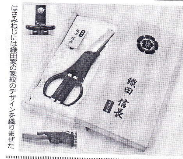
はさみねじには織田家の家紋のデザインを織りませた