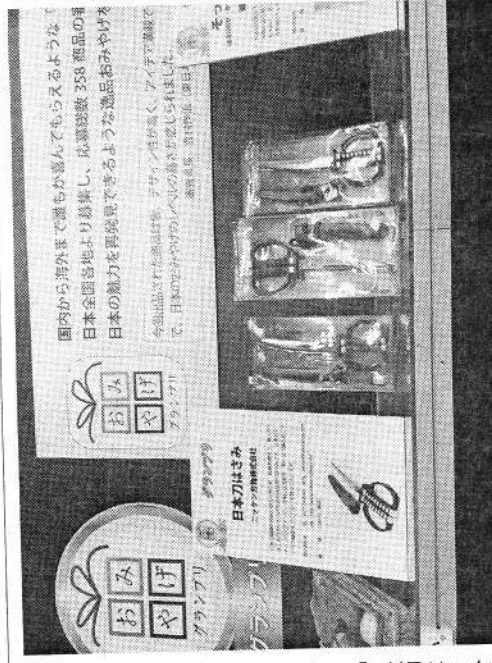
グランプリと観光庁長官賞に輝いた日本刀はさみ